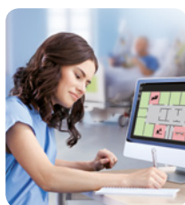
EMR-ready & SafetyMonitor