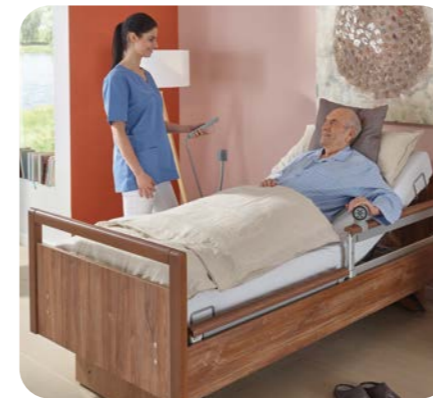
Einfache Bettbedienung für den Bewohner

SafeLift bietet einfachste Bedienung, sodass der Bewohner sein Bett selbstständig verstellen und in die für ihn optimale Mobilisationsposition bringen kann. Gleichzeitig kann er sich beim Aufstehen auf dem SafeLift-Controller abstützen.