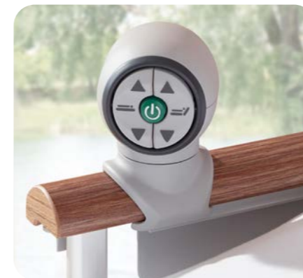
Controller ohne Kabel oder Batterie